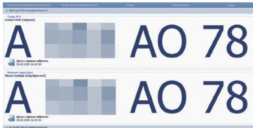
Отображение на мониторе ПК номеров ТС, находящихся в выбранных зонах